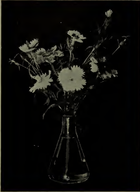
Dianthus heddeewigi —A fleurs simples.